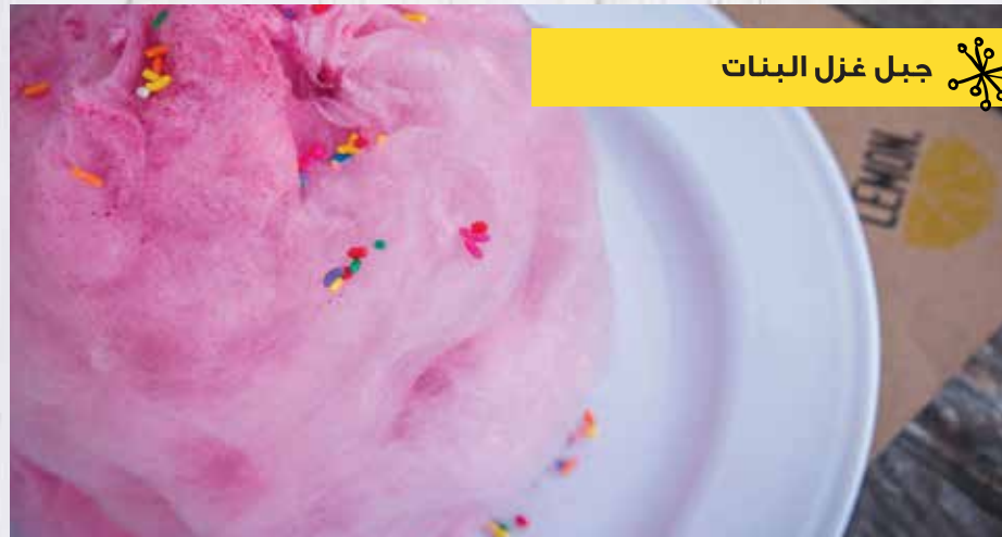
جبل غزل البنات