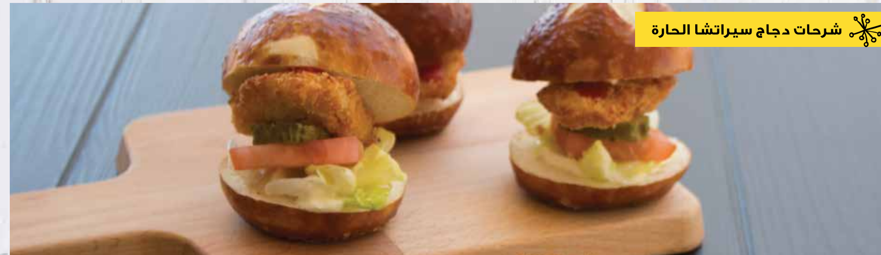
شرحات دجاج سيراتشا الحارة