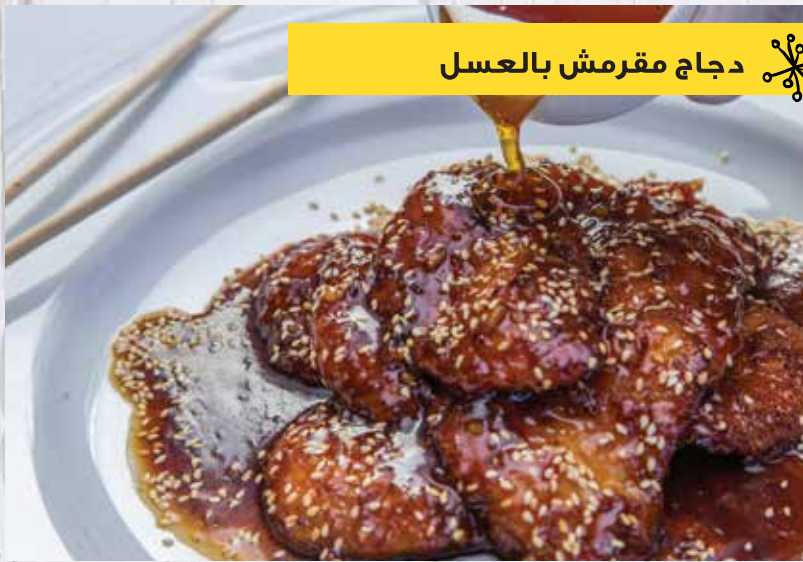
دجاج مقرمش بالعسل