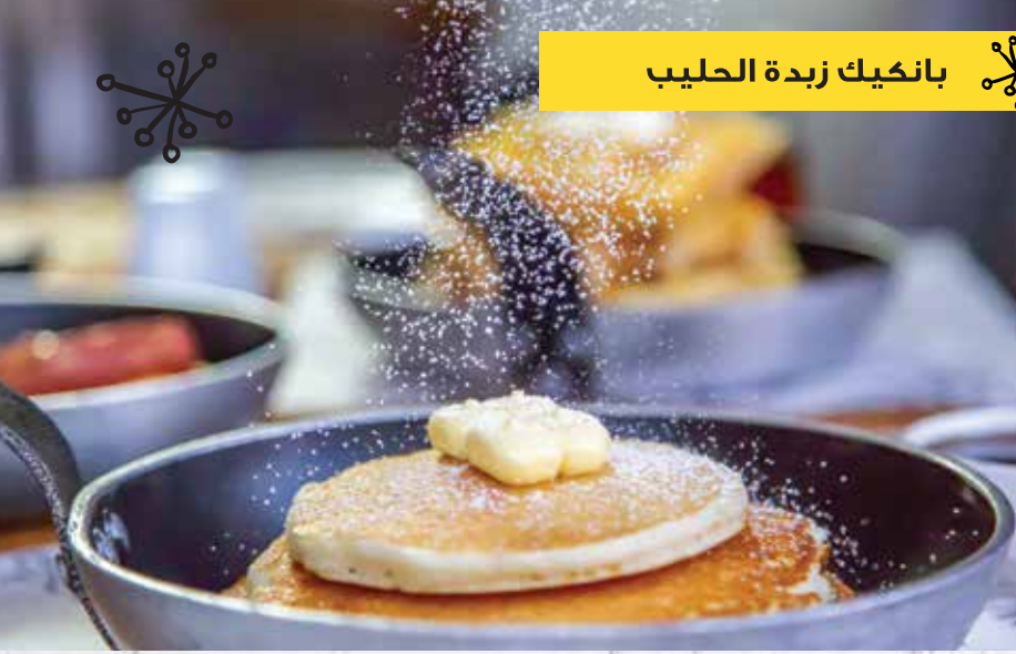
بانكيك زبدة الحليب