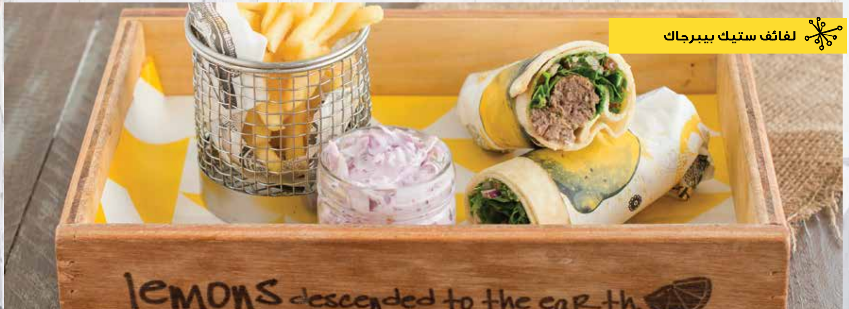
لفائف ستيك بيبرجاك

كل لفائفنا وندويشاتنا تقدم مع طبق جانبي من بطاطا مقليه وكوللو طازجه أو سلطة خضراء